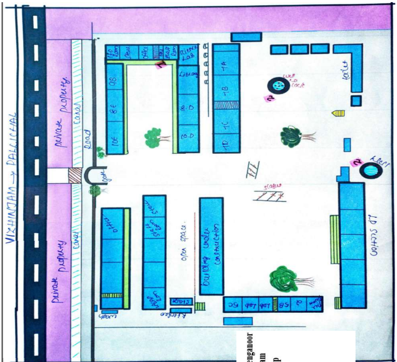
Name of School: GMHSS Venganoor District: Thiruvananthapuram Name of Map: Resource Map Legend: 1. Health Nurse Rooms 2. Open wells Map prepared by students Map not in scale

1. സ്കൂളിലെ സൗകര്യങ്ങൾ വിവരിക്കുന്ന ഭൂപടം